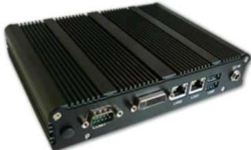
小型、壁設置可能なファンレス、ゼロスピンドル設計 価格 オープンプライス

ガードボックスサーバは、50人以下の中小規模オフィス、企業の部門導入に適した小型IP電話サーバです。IP電話に必要なサーバ機能、暗号化機能、IP電話キャリアや一般公衆網との接続インターフェースを持ち、ルーター・VoIPというインターネットを利用して音声データを送受信する為のゲートウェイ・PBX機能を内蔵するオールインワン・アプライアンス・サーバです。